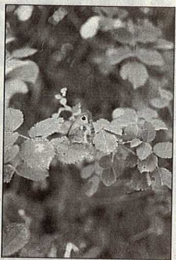
“ La nature dans tous ses états ”, tel sera le thème des Premières rencontres photographiques du Genevois.

Peut-être avez-vous remarqué la grande photo (1 mètre sur 3 mètres) qui trône sur la façade de l'école de la Présentation de Marie ? Cette œuvre artistique est un avant-goût des “ Premières rencontres photographiques du Genevois ” qui se dérouleront du lundi 29 septembre au dimanche 5 octobre à Saint-Julien-en-Genevois. Cette grande manifestation est l'œuvre de l'association “ Contact Image ”, fondée il y a une année par une vingtaine de passionnés de photographie. Le programme de cette première est ambitieux et débutera avec, durant toute la semaine, des photographies d'amateurs exposées dans une vingtaine de commerces du centre-ville. Mais c'est pendant le week-end que se dérouleront les événements majeurs de cette manifestation avec